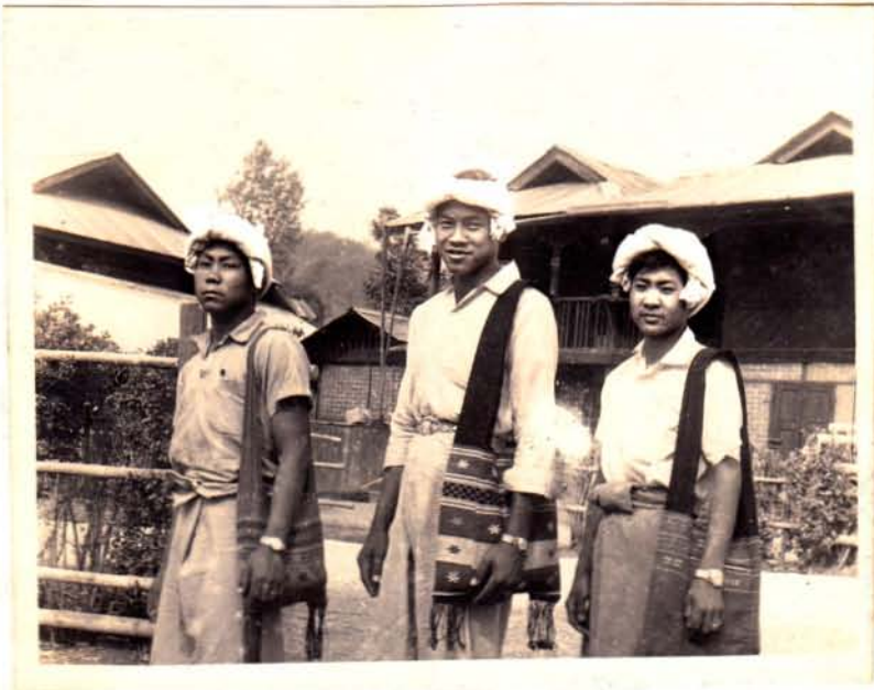
--- စောဝင်ရိုး လှလင်ပျိုများ ---