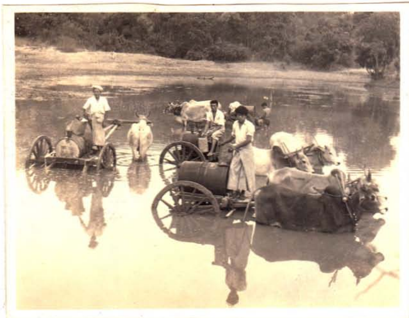
တောင်ဂျီး လူငယ်များ လှည်းဖြင့် ရေခပ်ဆင်း နေပုံ