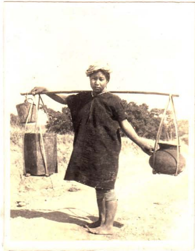
တောင်ဂျီး အမျိုးသမီး ရေခပ်ယူခန်း နေပုံ