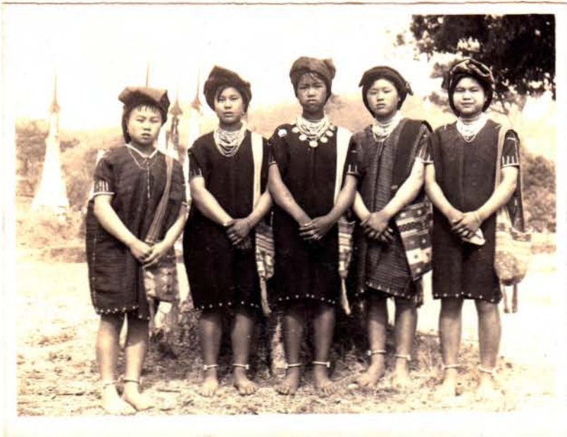
--- စောဝင်ရိုး လုံမပျိုများ ---