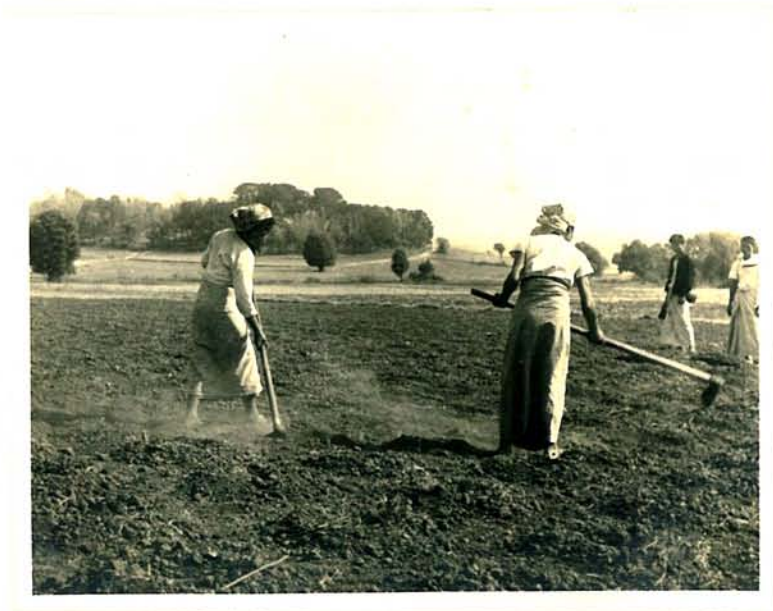
တောင်ယာစိုက်ပျိုး နေသော တောင်ရိုး အမျိုးသမီးများနှင့် အမျိုးသားများ