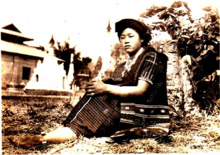
--- စောငင်ဂို: အမျိုးသမီး ---