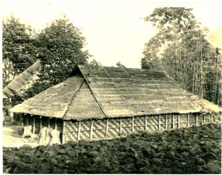
----- တောင်ငူတို့၏ နေအိမ် -----