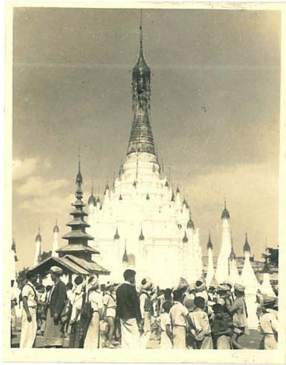
ကျုံး စေတီနှင့် တောင်ငိုဦး ဗုဒ္ဓဝယ်များ