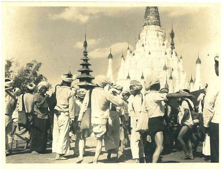
တာတက်ပွဲကျင်းပနေပုံ