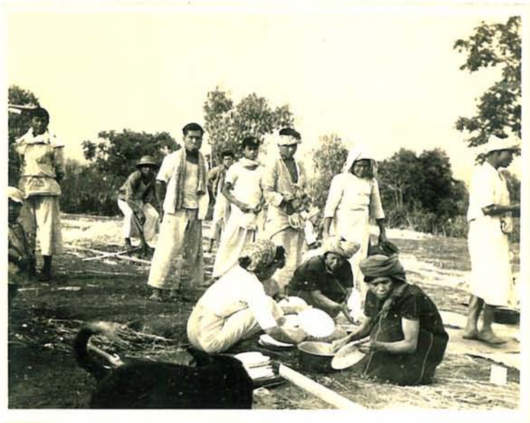
မီး လောင်း ပြင်စွင် စောင်းရိုး လှယ်များ ကုညီလှဝီကိုင် နေပြင်