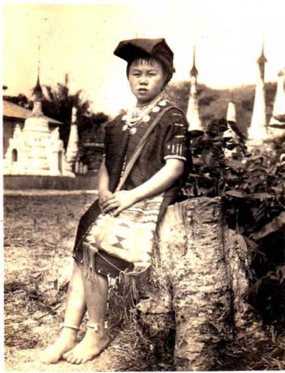
--- စောငင်ဂို: အမျိုးသမီး ---