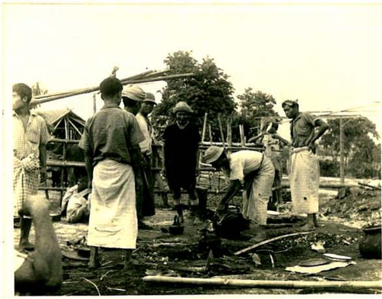
မီး လောင်း ပြင်စွင် စောင်းရိုး လှယ်များ ကုညီလှဝီကိုင် နေကြို