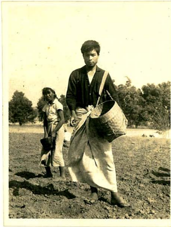
တောင်ယာစိုက်ပျိုး နေသော တောင်ရိုး အမျိုးသမီးနှင့် အမျိုးသား